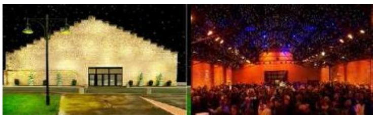
93210 La Plaine St-Denis